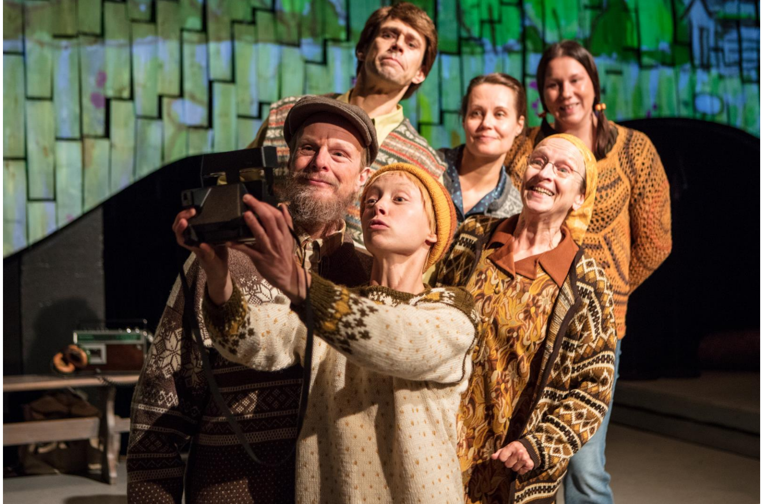
Kuvat: Kati Leinonen, Synninkantajat 2020