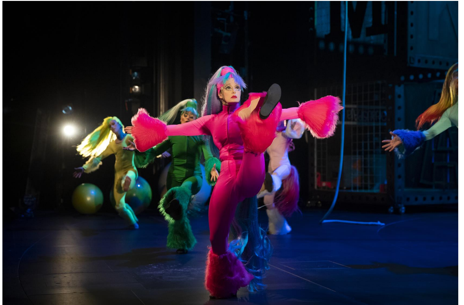
Kuva: Maiju Paloheimo, Kaboom ja kuvittelun voima 2020

Teatteri ei ainoastaan peilaa todellisuutta -se myös luo sitä