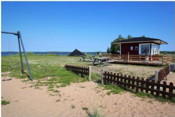
1) Uimarannan pohjoinen puoli. Kesäkioskin takana oleva nurmikenttä, jossa laavu, puucee ja puuvarasto