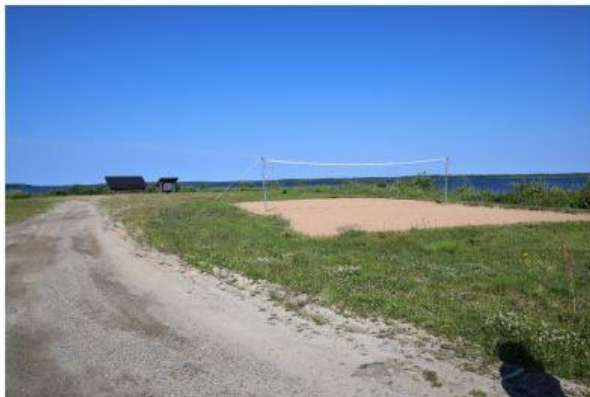
2) Uimarannan eteläinen puoli, jossa rantalentiskenttä ja laavu. Nurmikenttää.