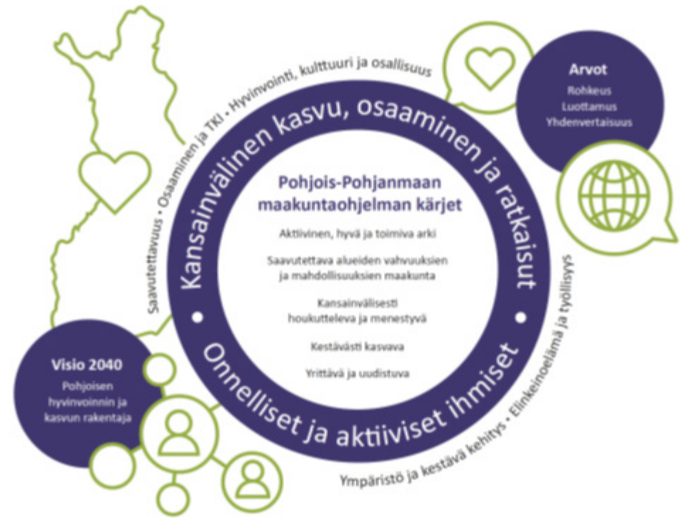
Kuva 3. Pohjois-Pohjanmaan maakuntaohjelman 2022-2025 kärkiteemat, arvot ja visiot (Julkaisu A:65, PPL).

Maakuntaohjelman toimeenpanoprosessia kehitetään vastaamaan aluekehittämisen tilannekuvaa sekä valtion ja maakunnan välistä aluekehityskeskustelua. Toimeenpano sisältää toimijoiden välistä läheistä yhteistyötä, kumppanuutta, jossa kullakin toimijalla on oma merkittävä roolinsa. Yhteisen prosessin kautta muotoutunut aluekehittämisen arvoperusta oikeuttaa ja velvoittaa kaikkia maakunnan tulevaisuuden tekijöitä. Maakuntaohjelman toimeenpanosuunnitelma huoltovarmuus ja kokonaisturvallisuusteemoilla hyväksyttiin maakuntahallituksessa maaliskuussa 2024. Uuden maakuntaohjelman 2026-2029 valmistelu on käynnistetty maakuntahallituksen päätöksellä loppuvuodesta 2024 19.11.2024 § 181 .